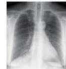
胸部エックス線検査

最後に、肺がんの最大の原因は喫煙です。「 禁煙 」することが肺がんでの死亡率を下げる有効な手段であるをご理解ください。検診が終わったら当院の「 禁煙外来の受診 」もお考えいただければ幸いです。