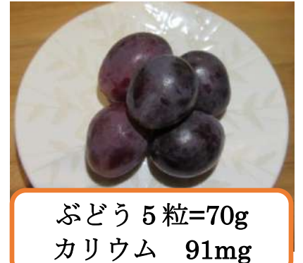
ぶどう 5 粒=70g カリウム 91mg