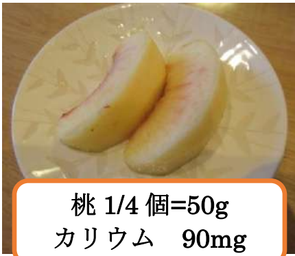
桃 1/4 個=50g カリウム 90mg