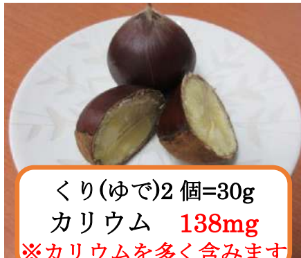
くり(ゆで)2 個=30g カリウム 138mg ※カリウムを多く含みます