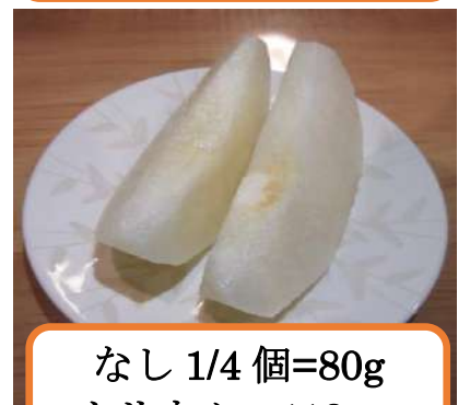
なし 1/4 個=80g カリウム 112mg