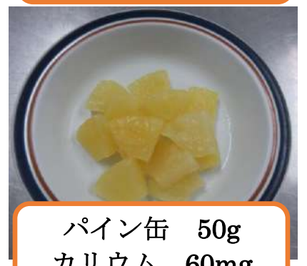
パイナップル缶 50g カリウム 60mg