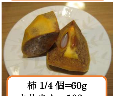
柿 1/4 個=60g カリウム 102mg