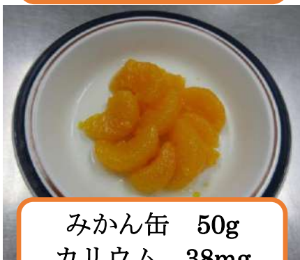
みかん缶 50g カリウム 38mg