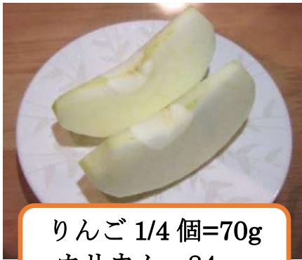
りんご 1/4 個=70g カリウム 84mg