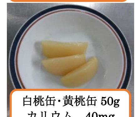
白桃缶・黄桃缶 50g カリウム 40mg